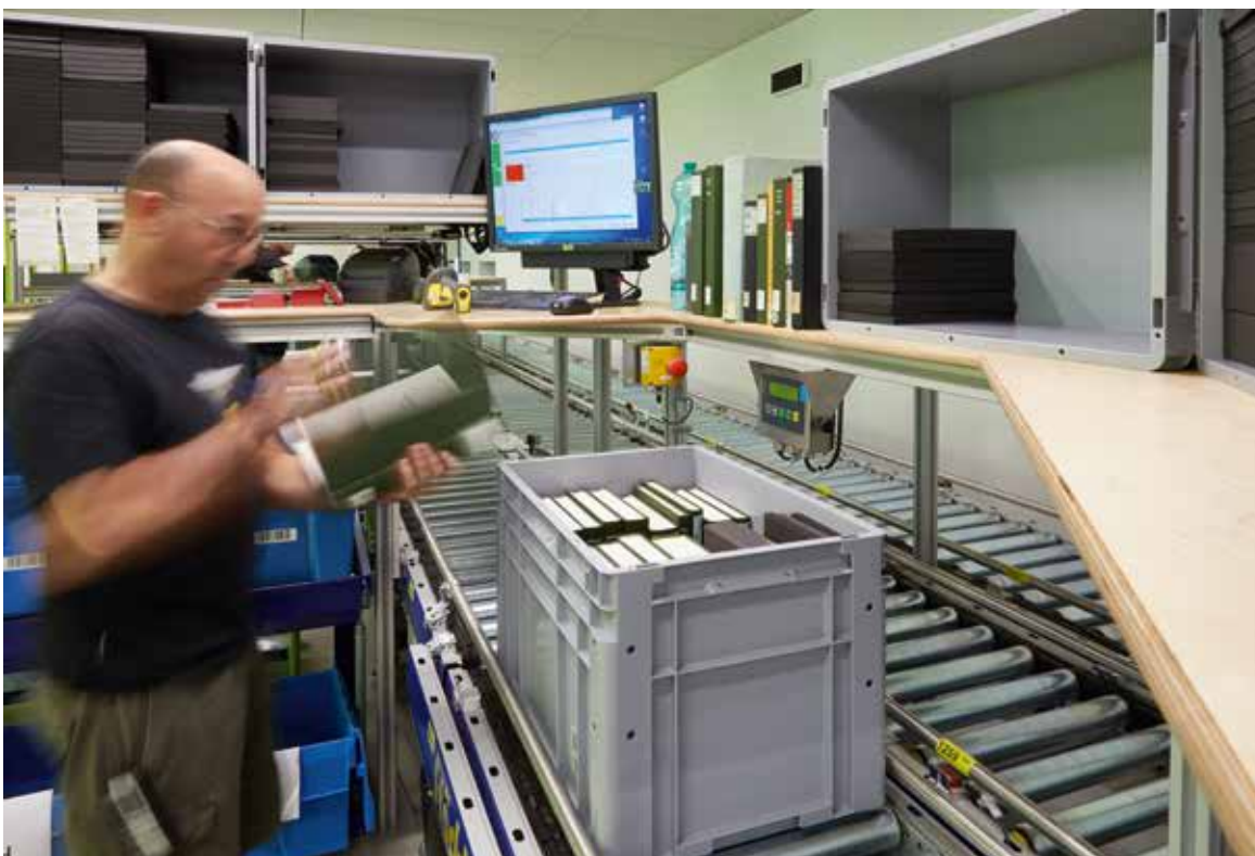
Logistikmitarbeiter am Kommissionierplatz (Urheber: Ulrich Niederer)

Entwicklung der Werte für Temperatur, Luftfeuchtigkeit und Sauerstoffgehalt (Urheber: Mike Märki)