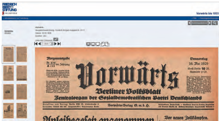
Abbildung 2: Ansicht des ersten Treffers auf der Ausga- benebene